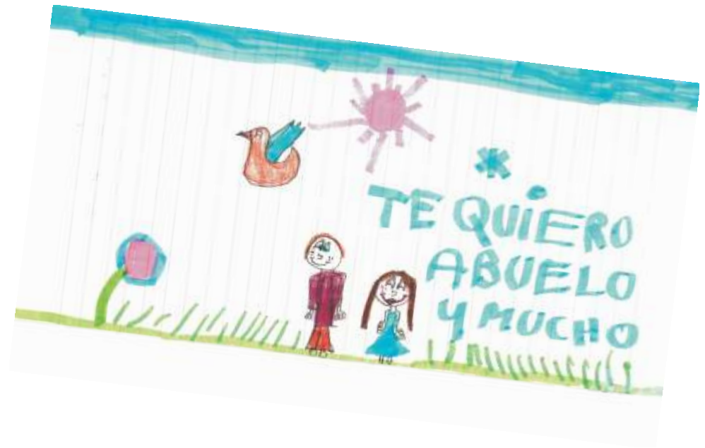
guadalupe cubecino 7 años