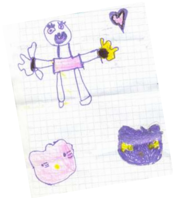
rocío elaskar 6 años